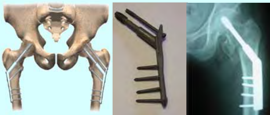
大腿骨転子部骨折の手術

骨にズレがある転子部骨折では、変形治療防止、入院期間の短縮、費用の削減などの面から、骨接合術が行われるべきであると考えられています。