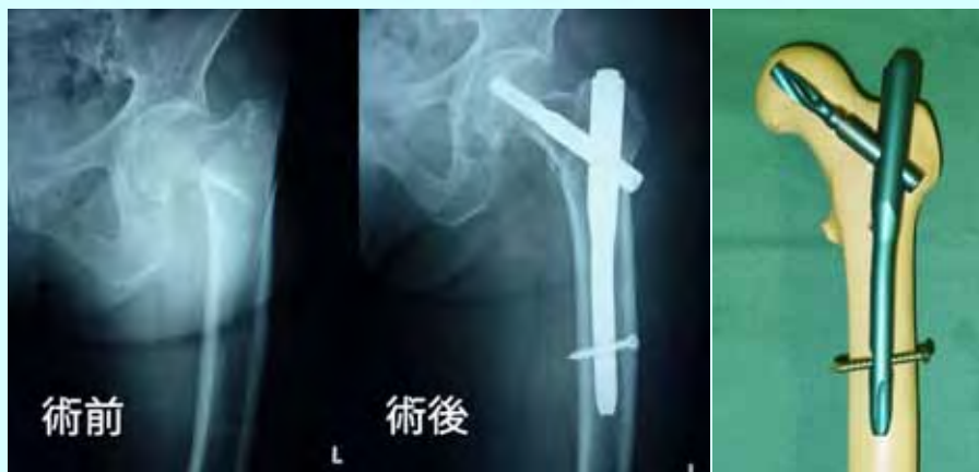
大腿骨転子部骨折の手術