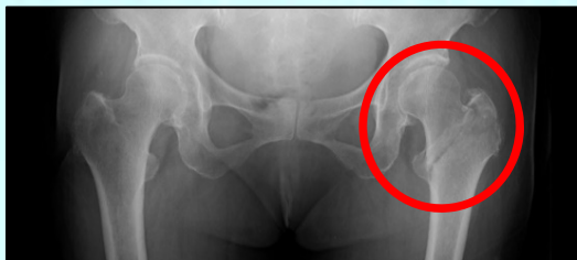
大腿骨転子部骨折