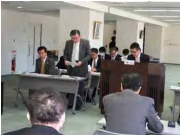
提案理由を説明する羽田組合長