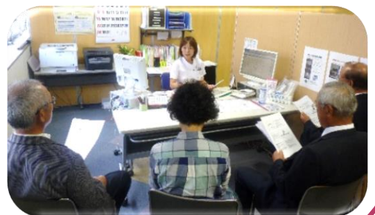
入院支援センターでの説明

平成29年10月3日、病院モニター見学会・懇談会を開催しました。病院モニター制度の充実を図るため、平成29年4月から新たに6名の病院モニターが委嘱されました。 当病院を知ってもらうために、栄養科や地域医療連携室、入院支援センター等を見学し、担当職員から説明を受けました。この後、行われまして懇談会では、経営状況や今後の地域医療の在り方、認知症問題等の意見交換が行われました。 モニターの方々から頂いたご意見やご要望は、今後の病院運営に活かしていきたいと考えております。